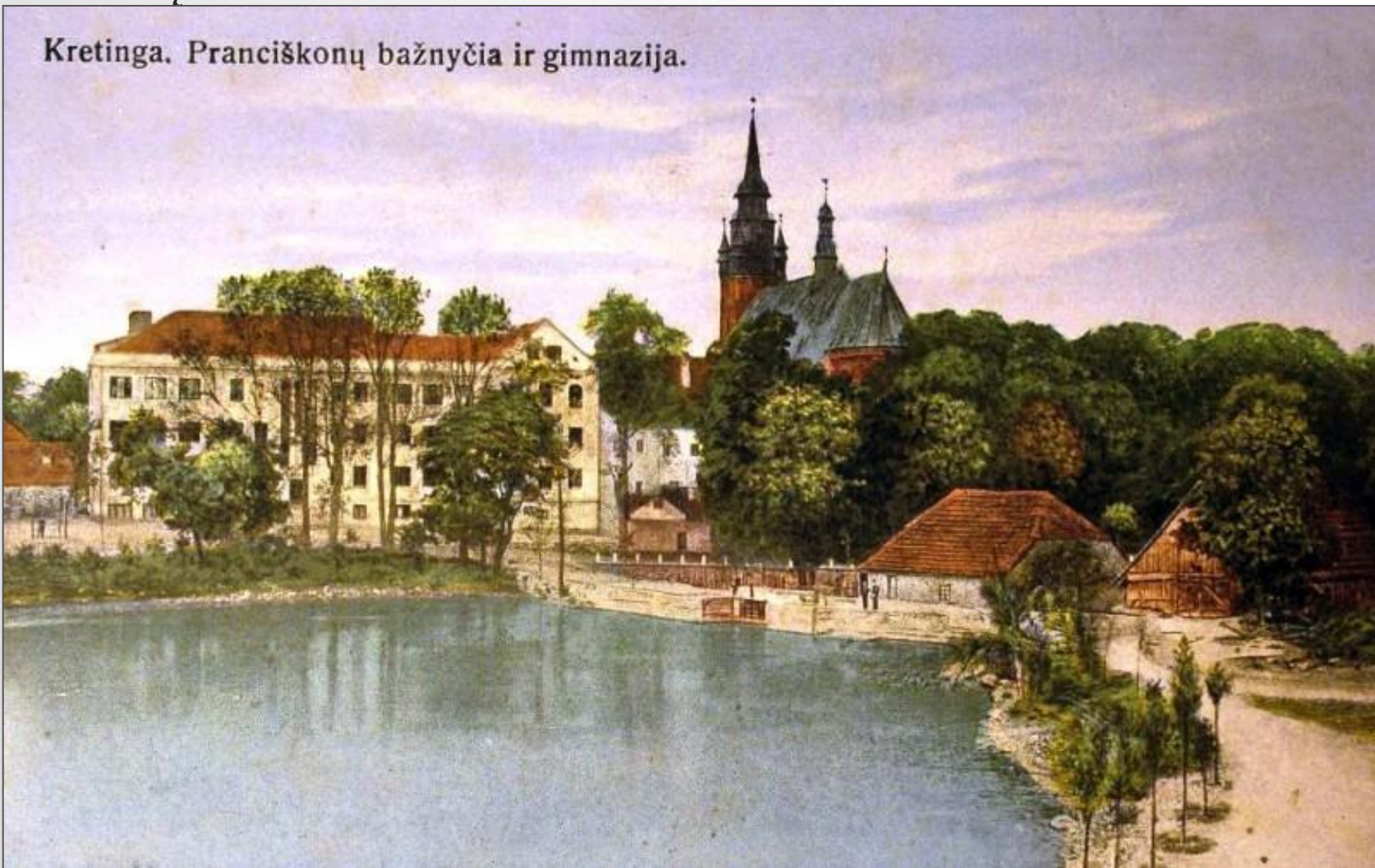
Kretinga. Pranciškonų bažnyčia ir gimnazija.